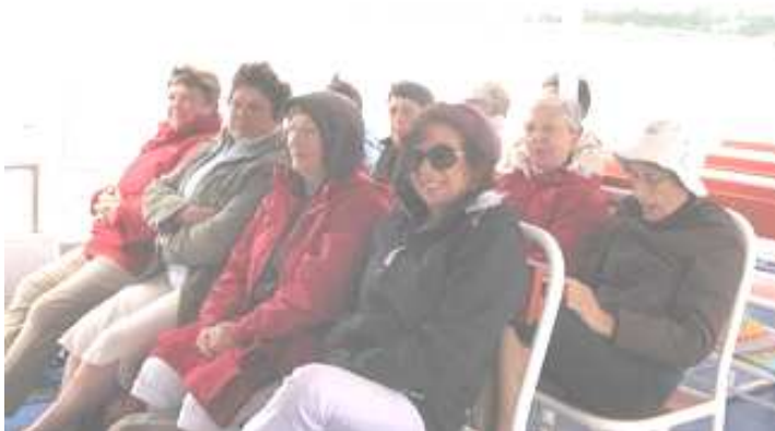
Sortie de la section gym aux Glénan

La gym féminine, cette saison a bien fonctionné avec un effectif d'environ 80 personnes. C'est plus que l'an passé et pourtant l'inquiétude commençait à nous gagner lorsqu'une animatrice nous a annoncé qu'elle souhaitait arrêter. Heureusement, nous avons trouvé une remplaçante parmi nos adhérentes et la saison prochaine sera assurée dans de bonnes conditions de la manière suivante :